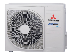
Buitenunit SRC60ZSX-W3 6,0 kW 220/240V-1-50Hz warmtepomp inverter R32 7000823