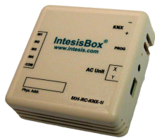
Interface INKNXMHI001R000 met KNX TP-1 protocol 7090876