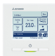
Ecotouch bediening RC-EX3A 7140497