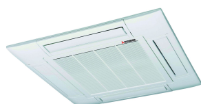
Paneel T-PSA-5BW-E/1 t.b.v. cassette FDT 7140476