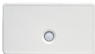
Bewegingsmelder LB-T-5BW-E t.b.v. cassette FDT 7140479