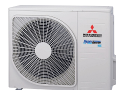
Buitenunit SRC50ZSX-W3 5,0 kW 220/240V-1-50Hz warmtepomp inverter R32 7000822