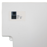
Infraroodbediening RCN-T-5BW-E2 t.b.v. cassette FDT 7140478